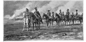
WOJSKO KSIĘSTWA WARSZAWSKIEGO.