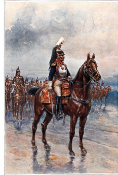
GENERAŁ WYWIŻY KRZYŻANOW

WARSZAWA GEMBARZEWSKI I WOLFF WYDAWCA G. GEMBARZEWSKI 1905