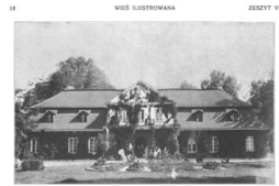
WIEŚ DAWNA A DZISIEJSZA PR. WSPOMNIENIA (KAWCZYŃSKA)

WIEŚ DAWNA A DZISIEJSZA Pr. WSPOMNIENIA (KAWCZYŃSKA) WIEŚ DAWNA A DZISIEJSZA Pr. WSPOMNIENIA (KAWCZYŃSKA)