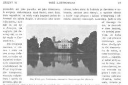
WIEŚ DAWNA A DZISIEJSZA PR. WSPOMNIENIA (KAWCZYŃSKA)

WIEŚ DAWNA A DZISIEJSZA Pr. WSPOMNIENIA (KAWCZYŃSKA) WIEŚ DAWNA A DZISIEJSZA Pr. WSPOMNIENIA (KAWCZYŃSKA)