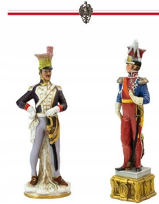
Figurki kolumnowe, wykonane w Krasnym i Mławie. Na stronie opposite (prawy) Figurka, na stronie przeciwnej (lewy) Figurka, 1813.