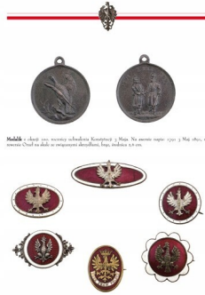
Medale i kawałki monety wybite w Krasnym i Mławie. Na stronie opposite (prawy) Medal, na stronie przeciwnej (lewy) Medal, 1813.