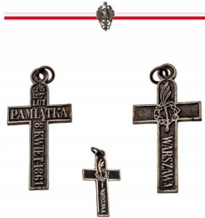
Do krzyży powstała Medalsy Warszawskich i 1813, o wymiarach 8 x 4,4 cm oraz 4,1 x 3,1 cm, wykonane z brązu, srebra i miedzi.