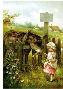
BUREK I JANKA.

Druga na polu jak obłąka... Dwa dwa wędki i pługie, Pasterka w sad leci na miotły, A dżozu skrzyje w wodę.