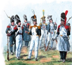
Serya II. Wojsko polskie po r. 1800. Tab. 187.

Przesyłając do wiadomości Wojska, któremu mam zaszczyt dowodzić, przepis Munduru przez