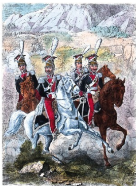
Serya II. Wojsko polskie po r. 1800. Tab. 186.

Mundur galowy — Składa się z kurtki sukiennej, koloru granatowego, krojem Polskim, podszyciey kołozą karmazynową; kołnierz stojący z sukna karmazynowego; wyłogi i łapki na rękawach okrągłe, granatowe. Kurtka zapinać się będzie wzdłuż, od góry do dołu, na hafiki; kieszenie wzdłuż, z trzema kantami; wypustka karmazyno- wa, na około wyłogów, łapek na szwach rękawów i na plecach. Guziki srebrne wypukłe na których znayduwać się ma robotą wypukłą (en relief) Orzeł Polski; na wyłogach z każdej strony po siedm guzi- ków, przy każdej kieszeni po trzy, z tyłu na faldach po dwa, do każdej szlify po jednemu. Kamizelka biała krótka, której nie widać z pod kurtki. Spodnie długie z sukna karmazynowego, z lampasami