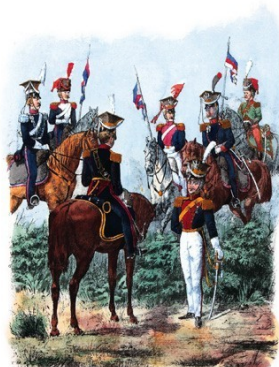
Serya II. Wojsko polskie po r. 1800. Tab. 188.