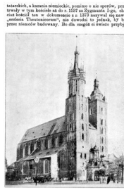
Rys. 16. Bazylika Ducha Świętego w Wrocławiu.