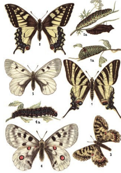
1. Motyl żółtaczka z listką 1a; 2. M. paź królowej z listką 1 i poczwarką 2a; 3. Yalo Polkowna; 4. Niszytek Apolo z listką 4a; 5. N. Macmurtrei.