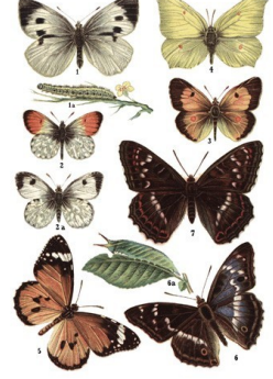
1. Białelnik kapucznik; 2. Zoryczka wzmocniona; 3. M. 4. Salsola wzmocniona; 5. L. 6. M. 7. L.