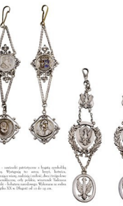
Bransoletka - bransoletka wykonana z srebra, brzoza, koronki. Na łańcuszku zawieszona jest medałka. Waga 100 g. Cena 100 zł.