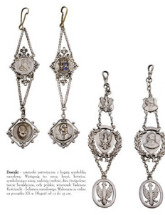
Wisiorek - srebrny wisiorek z kruszcu 800, wykonany przez Felixa Hönigera w Kolonii w 1870 r. Waga wisiorka wynosi 10 g.