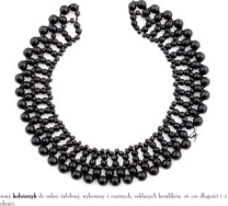
Srebro - srebrny naszyjnik. Wiek XIX. Wzrost: 15 cm. Szerokość: 5 cm. Srebrny naszyjnik. Wiek XIX. Wzrost: 15 cm. Szerokość: 5 cm.