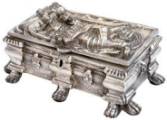
Skrytka - srebrna skrytka. Wykonana przez artystę polskiego i niemieckiego, Felixa Hönigera z Kolonii. Jest to jeden z nielicznych srebrnych skrytek, które zostały wykonane w XIX w. Skrytka posiada zamknięcie typu „kieszonkowy” i jest wykonana z srebra 900. Waga skrytki wynosi 1000 g. Skrytka została wykonana w Kolonii w 1870 r.