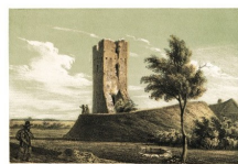
WIEŻA W STOLI.