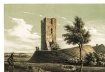
SIENIA W STERPI.