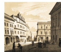
RYNEK I ULICA KASZUBKA. RYNEK I ULICA KASZUBKA.